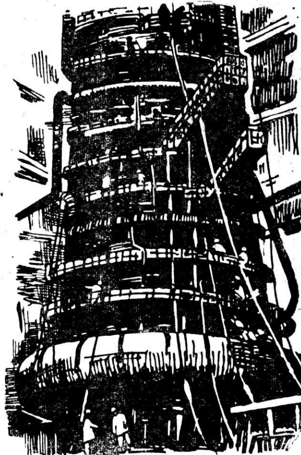
Рис. П. ХНЫКИНА.