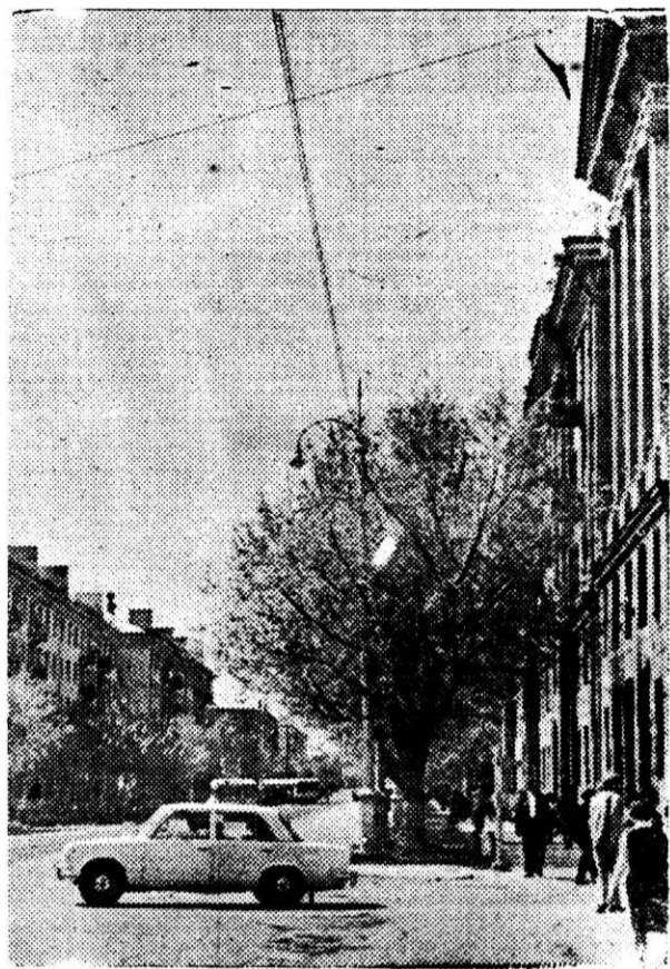
На снимке: улица Жданова.