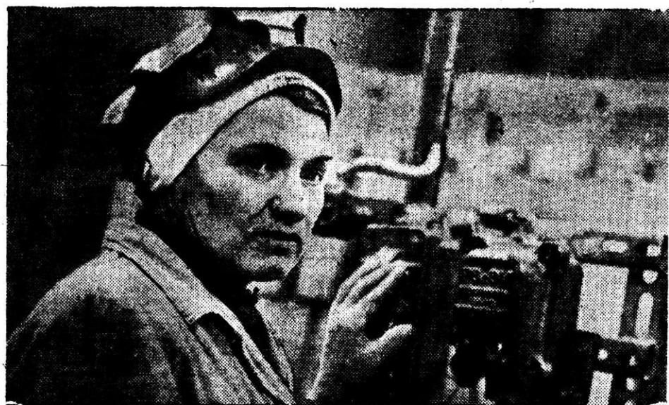
Коллектив огнеупорного производства, включившийся в соревнование за достойную встречу Дня металлурга, наращивает темпы выпуска продукции и стремится улучшить ее качество.

Обзор подготовлен сотрудниками научно-технической библиотеки комбината.