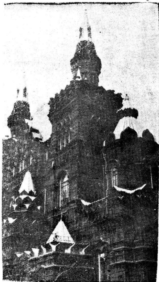
Государственный ордена Ленина исторический музей.