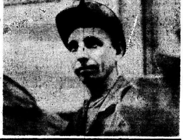
РЕКОНСТРУКЦИЯ КОМБИНАТА — УДАРНЫЙ ФРОНТ