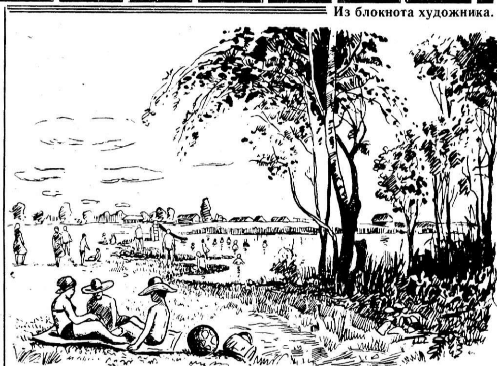
В выходной день на озере.