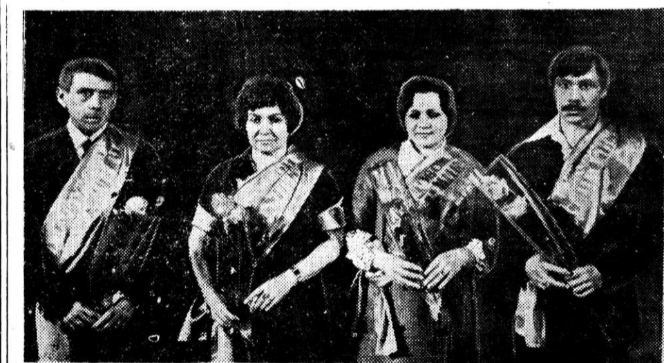
ЧЕСТВОВАНИЕ РАБОЧЕЙ ДИНАСТИИ

Известно, что глубина обсуждения вынесенных на бюро вопросов, конкретность и обоснованность принимаемых по ним решений зависит от уровня предварительной подготовки. Поэтому при комплектовании комиссии, которым поручают подготовку вопросов на бюро, учитывают компетентность и опыт работы коммунистов. Если, скажем, выносится вопрос о работе партгруп, то проверку поручают наиболее опытным партгрупоргам, которые могут не только проанализировать работу проверяемых, но и дать советы по ее улучшению, помочь устранить некоторые недостатки. К подготовке вопросов привлекаются также комиссии партийного контроля хозяй-