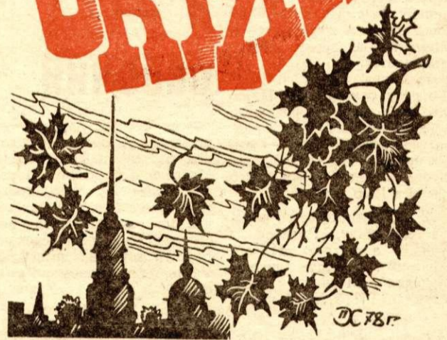
Плакаты П. Хныкина.