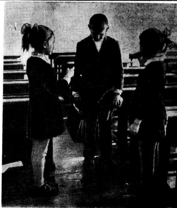
Неприятный разговор.

*** — Я вижу слезы,— дед сказал.— Ты с кем подрался, внук? — Не обижал меня никто, Я просто резал лук. — Но на рубашке у тебя Есть кровь — от драки след. А, может, краску ты пролил? Так краски в доме нет.