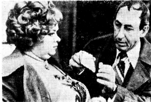
Кадр из фильма «Пена».