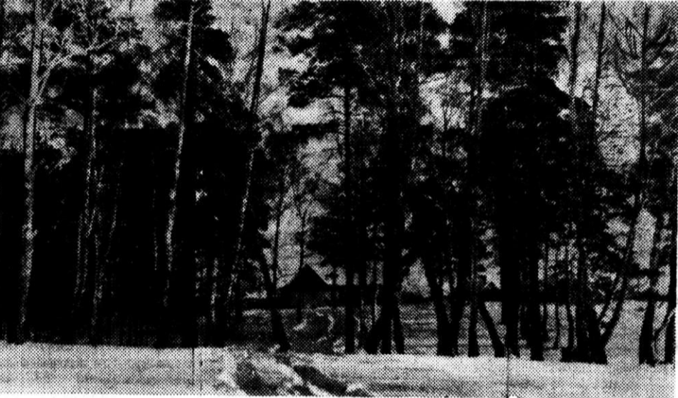
На исходе зимы.