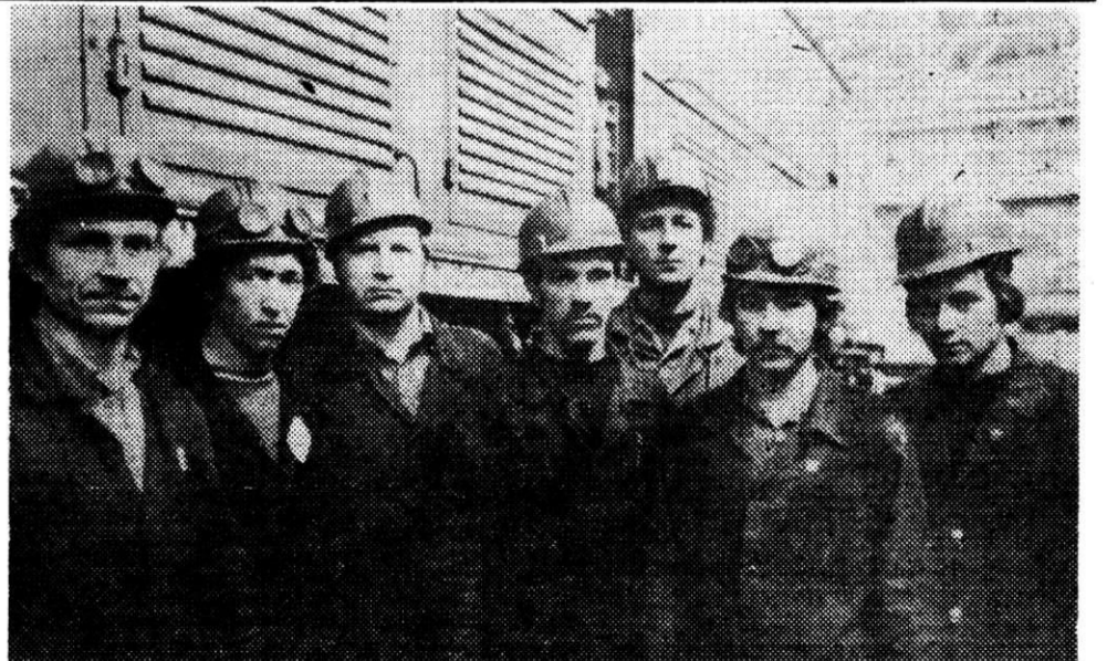
Активное участие в коммунистическом субботнике приняли труженники локомотивного цеха ЖДТ. За время субботников отремонтировано шесть локомотивов. Выполнены работы по изготовлению игровых аттракционов для подшефного микрорайона.

И. НЕЧАЕВА, инженер-конструктор технического отдела цеха вентиляции.