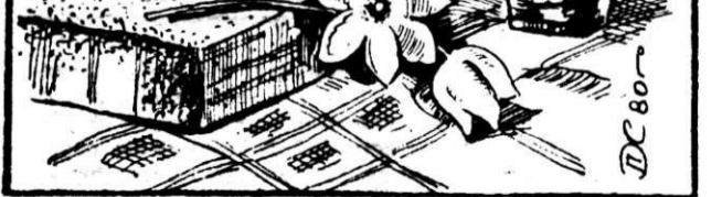
Натюрморт с полевыми цветами. Рис. П. ХНЫКИНА.