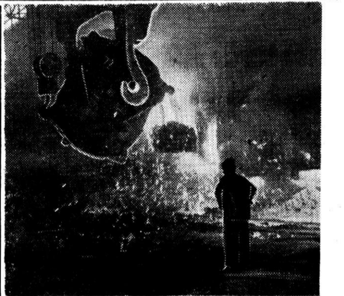
Заливка чугуна в мартеновскую печь.