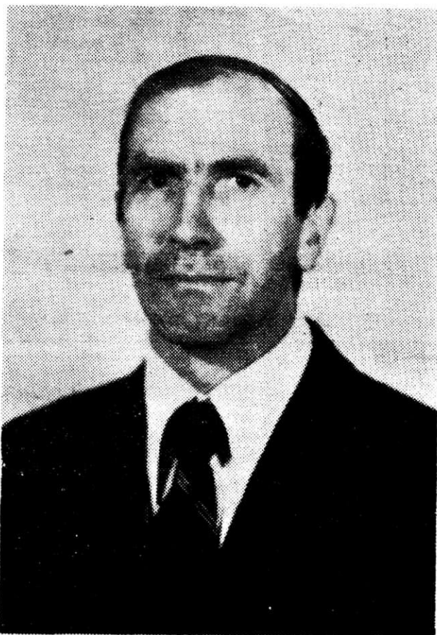
ПОЧИНУ — ЗЕЛЕНУЮ УЛИЦУ