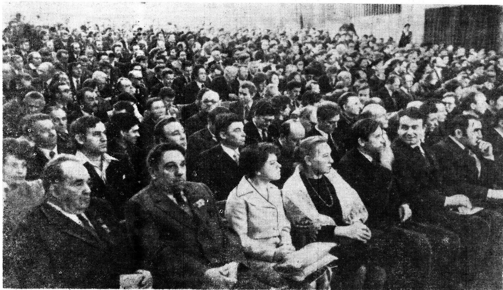
Делегаты в зале.