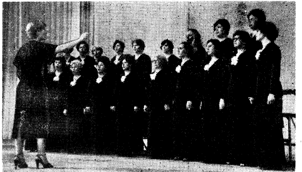
Хоровой коллектив ОДУ известен не только в своем коллективе. Он часто выступает в других цехах, перед грузчиками села. На снимке: идет репетиция хора ОДУ.

И. ГРИЩЕНКО, сотрудник магнитогорской картинной галереи.