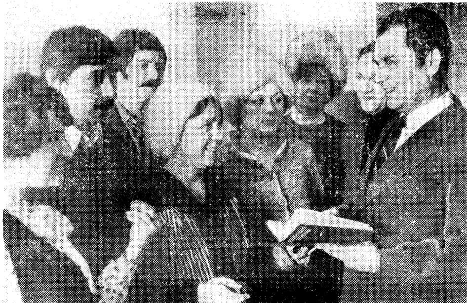
На снимке: группа студентов-прокатчиков индустриального техникума перед экзаменами.