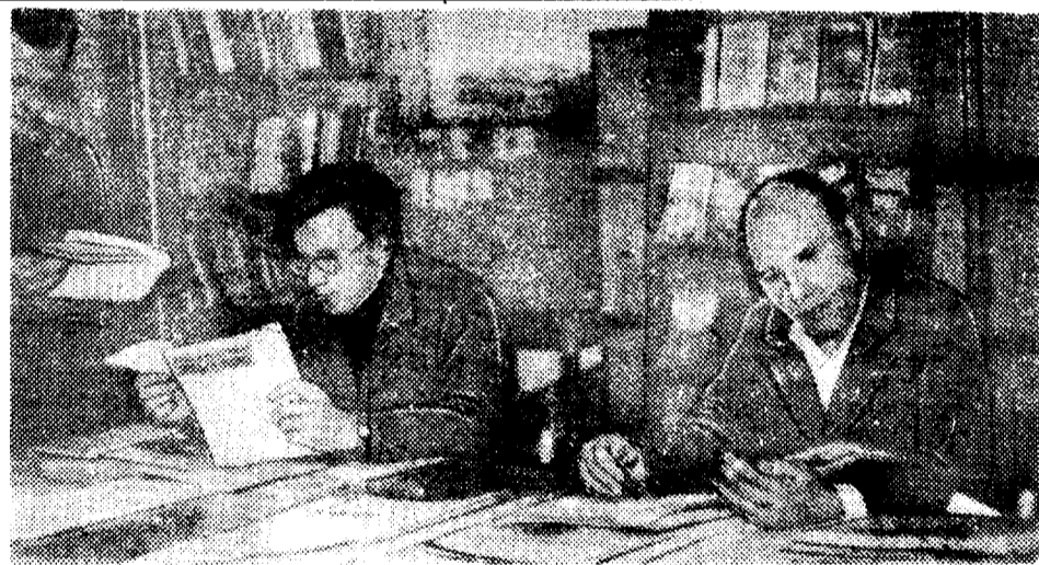
Просмотр технической литературы в библиотеке ЦЭТЛ.

Очередной номер выйдет 23 февраля 1981 года.