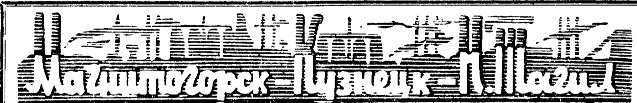
Итоги выполнения производственного плана за 22 дня февраля 1981 года по Магнитогорскому, Кузнецкому и Нижнетагильскому металлургическим комбинатам (в процентах)

Обзор подготовили инженеры по зарубежной информации ОНТИ ММИ.