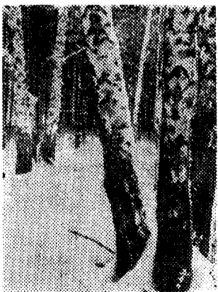
Зимний лес.