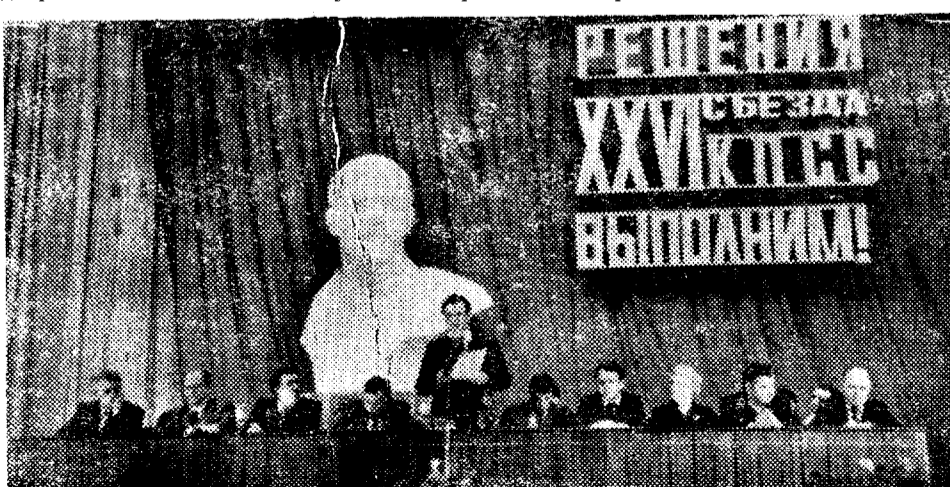
На снимках: на одном из собраний коммунистов комбината.