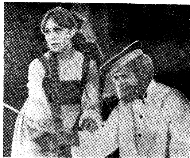
В репертуар театра имени А. С. Пушкина включен новый спектакль «Добрая слова». На снимке: сцена из спектакля.