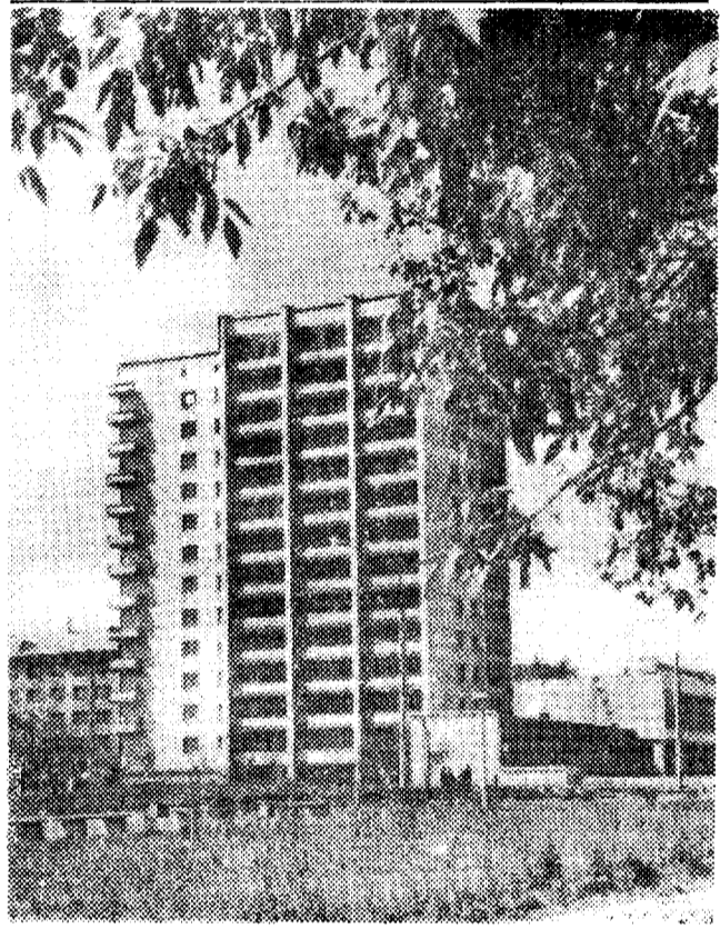
Уголок города.

ЧЕТВЕРГ, 9 июля Шестой канал 8.00. «Время». 8.40. Утренняя гимнастика. 9.05. «Линия жизни». Телевизионный многосерийный художественный фильм. 1-я серия. 10.10. Песня остается с человеком. 10.55. Программа телевизионных документальных фильмов. 11.25. и 14.00. Новости. 14.20. Твой труд — твоя высота. Кинопрограмма. 15.05. Концерт. 15.20. Н. Ненрасов — «Русские женщины». 15.50. Премьера телевизионного художественного фильма «Лето в Заборье». 16.55. Быт — забота общая. 17.25. К 60-летию победы народной революции в Монголии. Экран собирает друзей. СССР — МНР. 18.15. Сегодня в мире. 18.30. Концерт. 18.55. Содружество. 19.25. Премьера телевизионного многосерийного художественного фильма «Линия жизни». 2-я серия. 20.30. «Время». 21.05. Концерт народного артиста СССР Ю. Гуляева. Двенадцатый канал 10.00. «Время». 10.45. Отзовитесь, горнисты! 11.15. «Труд наш есть дело чести». 11.45. Веселые старты. 12.20. «Страны и цы Шолохова». Фильм-концерт. 12.55. Чему и как учат в ПТУ. 13.25. Концерт. 13.50. Фильм-детям. «Великое противостояние». Телевизионный художественный фильм. 1-я серия. 14.55. Встреча Д. Кабалев-