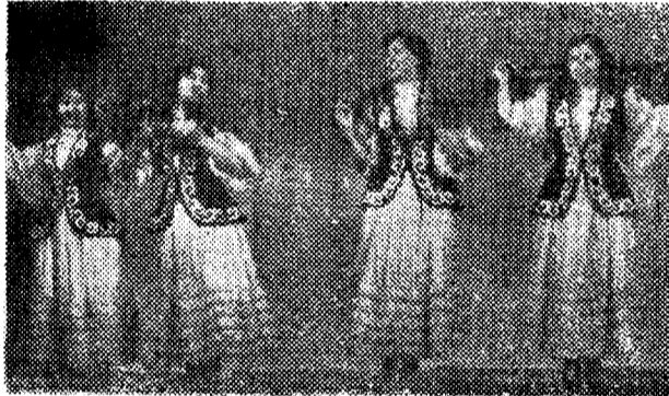
Выступает танцевально-эстрадный народный ансамбль танца.