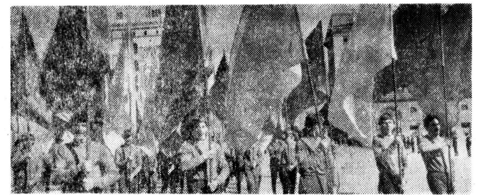
Физкультурники на параде.

И. КОЛОМЕЕЦ, наш общественный корреспондент.