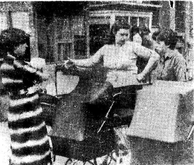
С каждым годом хорошеет наш город. Растут новые кварталы, открываются школы и детские сады. Новый Магнитогорск увидят его юные жители, которые пока путешествуют по его улицам в колясках. Залог тому — высокопроизводительный труд их отцов и матерей. На снимке: на перекрестке.