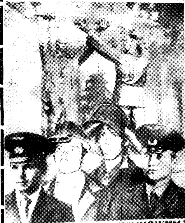
СЛАВУ ОЦЕВ ПРИУМНОЖИМ!

Горячий привет делегатам отчетно-выборной комсомольской конференции комбината!