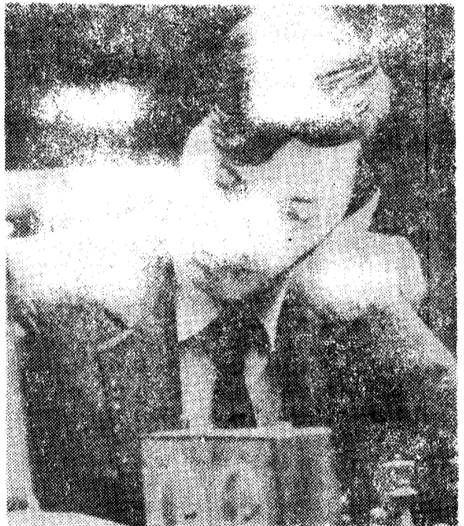
Внимание всего шахматного мира приковано сейчас к итальянскому городу Мерано, где проходит первенство мира по шахматам. После одиннадцати партий счет матча 4:1 в пользу чемпиона мира Анатолия Карпова. На снимке: играет чемпион мира.

А. ЗИГАНТРОВ, наш общественный корреспондент.