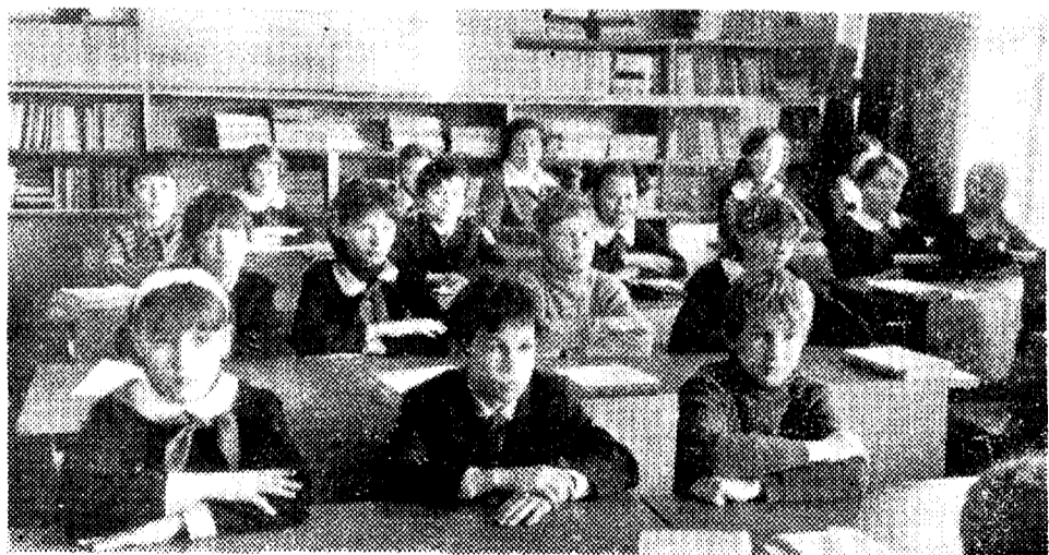
На снимке: 5 «А» класс — один из лучших по сбору макулатуры.