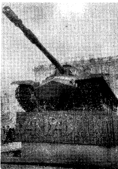
На снимке: монумент на площади Победы.

Не просто подобрать слова О первом дне его рождения. Прошло полвека, Не мгновенья, Но память памятью жила, Былая бьль — Не сновиденье. Мы ощущали зной жары, Нам был знаком Прюот палатки, В ней жгли нас Летом — комары, Зимой — мороз Во все лопатки. Пас не прельщали ордена, Не украшали груди медали. Металл... Его ждала страна — Святей святых Мы это знали. Живая память той поры — Давно гигант Расправил плечи, Вулканом дышат у горы Его стожаровые печи. Металл... О, сколько в нем добра! А ободясь, — Скажи на милость — Так В сорок первом и случилось — Была грозой Магнит-гора, А сталь — В снаряды превратилась. Бессмертна память Той поры — Мы не забудем ее вечно. Спокойно дышат у горы Завода Огненные печи. Гиганту нынче пятьдесят — Орденосцу, Исполнну. Он для меня — Мой младший брат, И потому Я дважды рад, Справляя эти именины. Живу — Не знаю, где конец, О смерти мысли не витают, Но труд бессмертен, Это знаю. Друзья! Наш юбиляр — юнец, Он только силу набирает. Михаил ЛЮГАРИН.