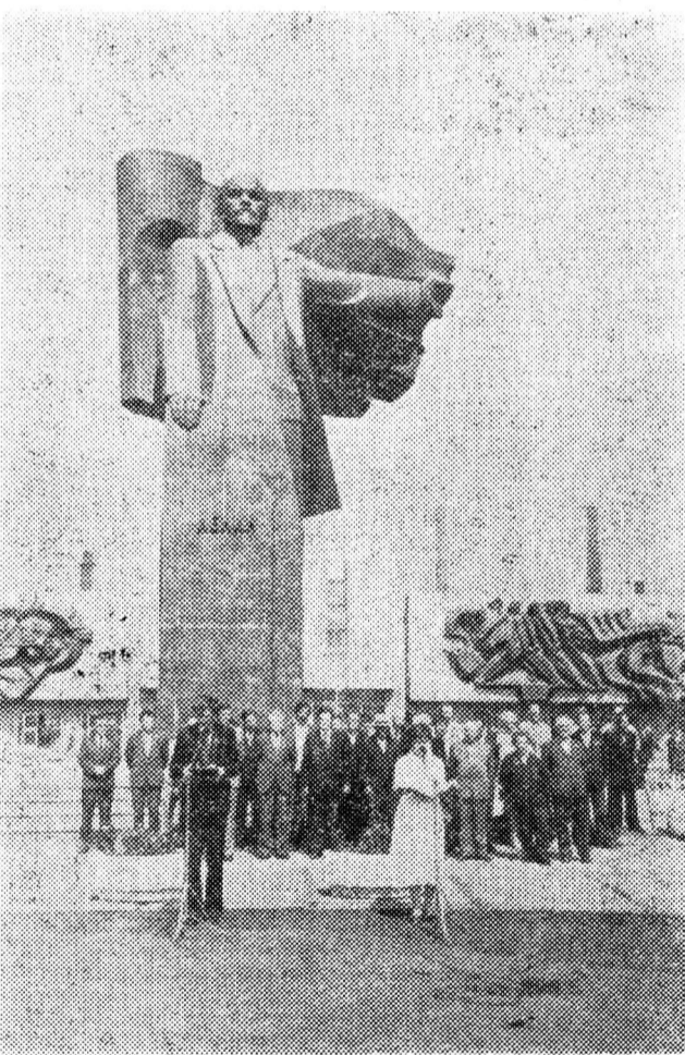
Второго июля на Комсомольской площади состоялось торжественное посвящение в рабочий класс выпускников базовых профессиональных училищ.

Репортаж о торжественном посвящении выпускников ГПУ в рабочий класс читайте на 2-й странице.