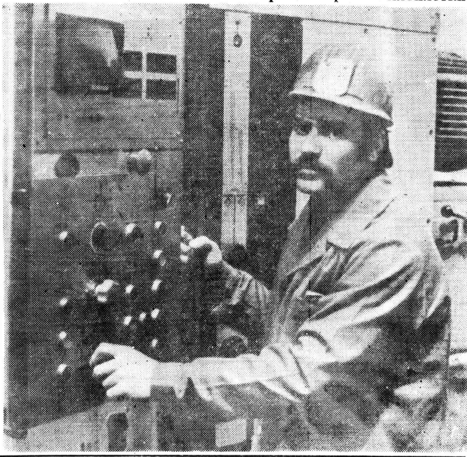
На правом фланге пятилетки

Бюро парткома приняло постановление, определившее широкий круг задач по повышению боевности и роли партийных организаций, авангардной роли каждого коммуниста. Безотлагательное, неотступное его выполнение призвано обеспечить преодоление затянувшегося отставания коксохимиков по выжигу кокса и выпуску другой продукции.