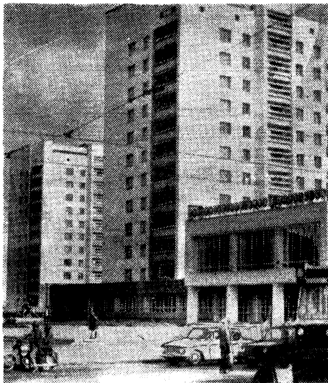
С каждым годом становится краше наш рабочий город. В его строительстве принимают активное участие строители комбината.

На снимке: улица Гагарина.