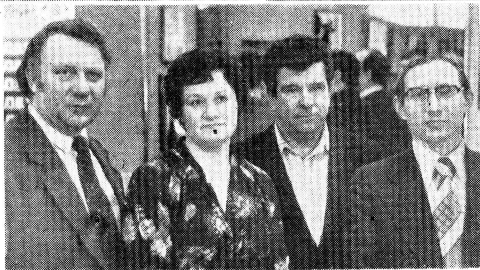
◆ Нормам безопасного труда — следовать!