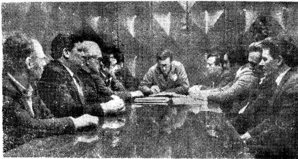
◆ ЗА СТРОКОЙ ПРОДОВОЛЬСТВЕННОЙ ПРОГРАММЫ. СТРОИТЕЛЬСТВО НА СЕЛЕ