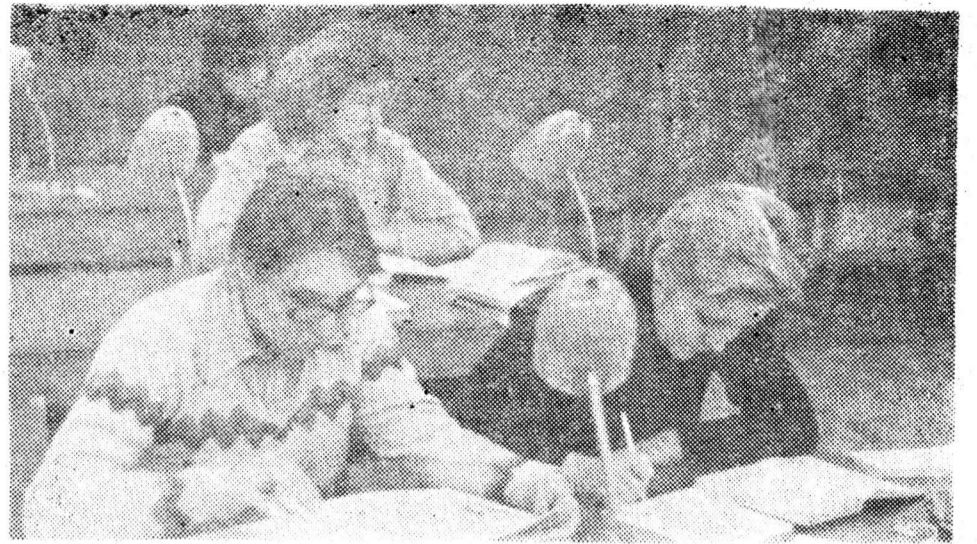
В читальном зале библиотеки.