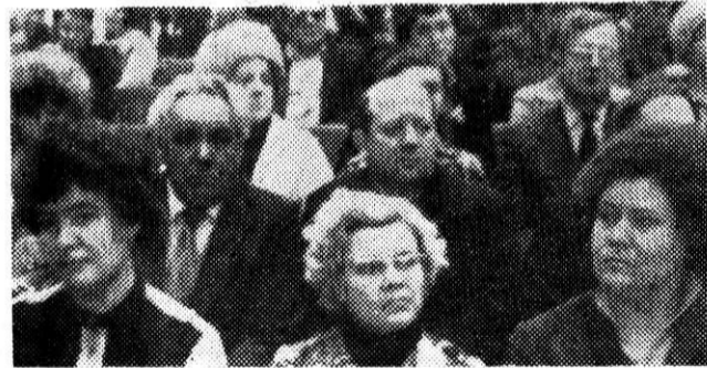
В зале во время работы конференции.

Таковы основные задачи, над выполнением которых мы начали сегодня работать. Разрешите выразить уверенность в том, что все намеченные нами обязательства в коллективном договоре на этот год станут реальностью.