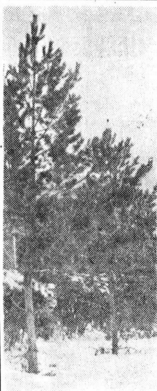
В зимнем лесу