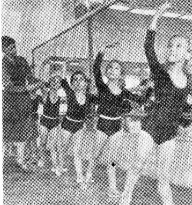
На занятиях балетной студии в ДКМ им. С. Орджоникидзе.