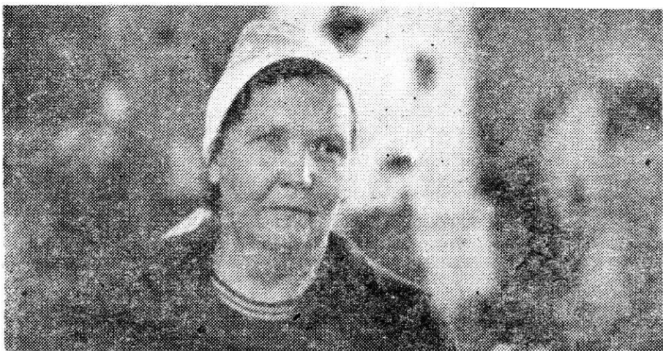
ЗА СТРОКОЙ СОЦОБЯЗАТЕЛЬСТВ

Первым пунктом в повышенных социалистических обязательствах коллектива второго обжимного цеха на 1983 год записано: годовую программу по объему производства завершить к 30 декабря. Заканчивается ноябрь, до конца года осталось чуть больше месяца, и мы, к сожалению, вынуждены констатировать, что накопили пока лишь солидную задолженность — отстали от плана на 56 тысяч 132 тонны.