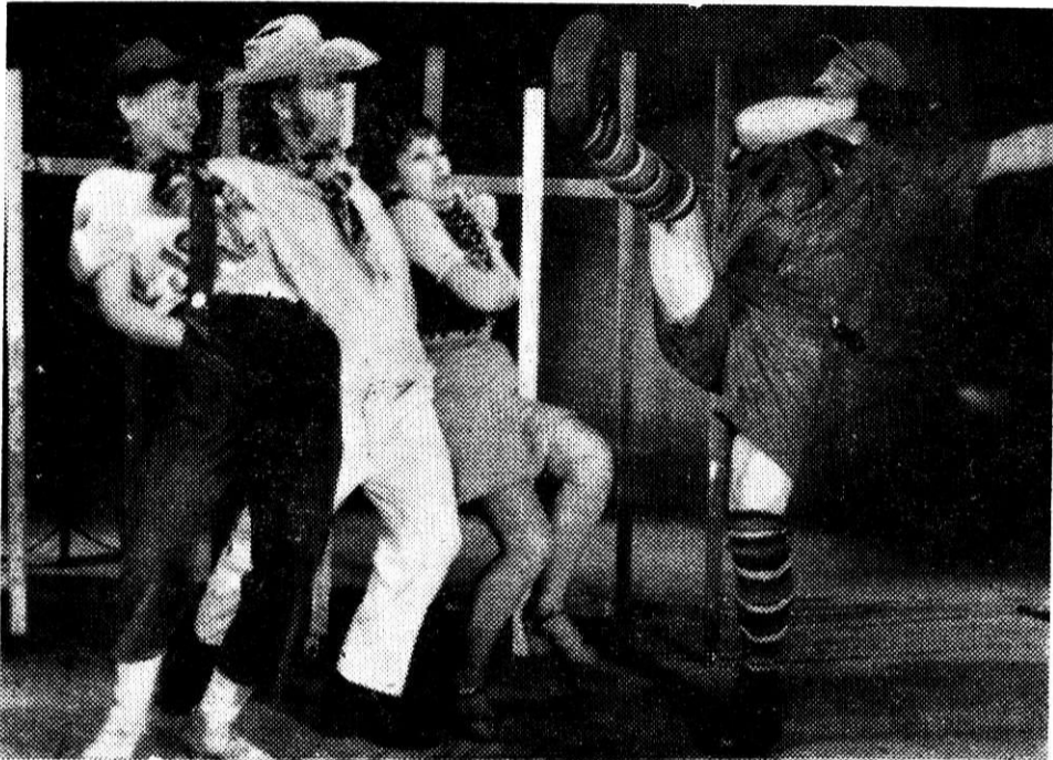
На снимке: сцена из спектакля «Сокровище Бразилии».