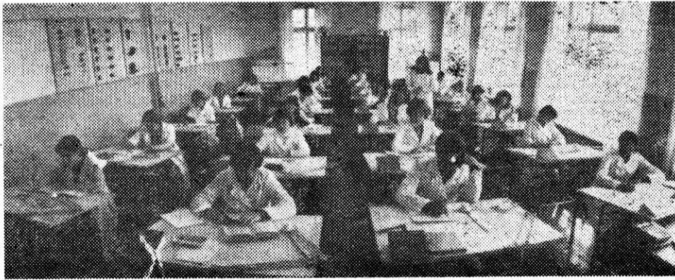
На снимке: идет очередное занятие в учебном цехе комбината.