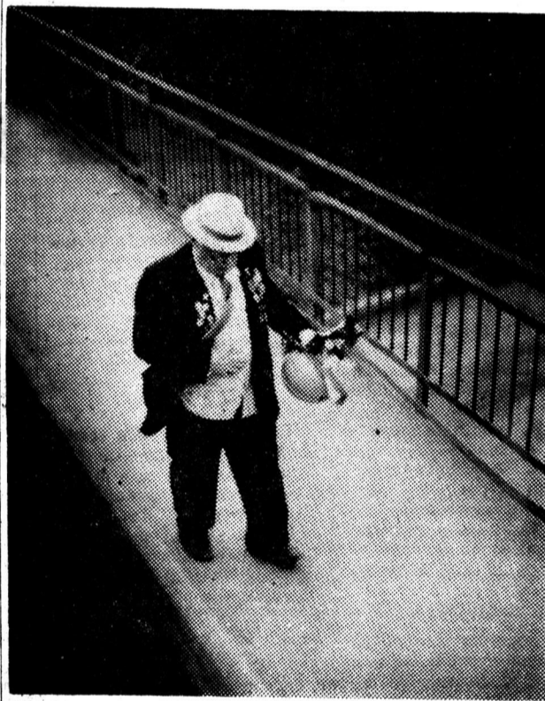
На заслуженный отдых.