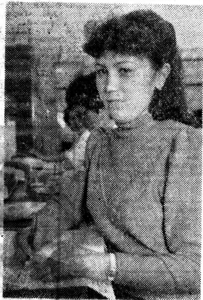
Фото и текст Н. Нестеренко.

Что еще говорят о ней? Человек она безотказный, исполнительный и надежный. Значит, Мархаба пользуется доверием.