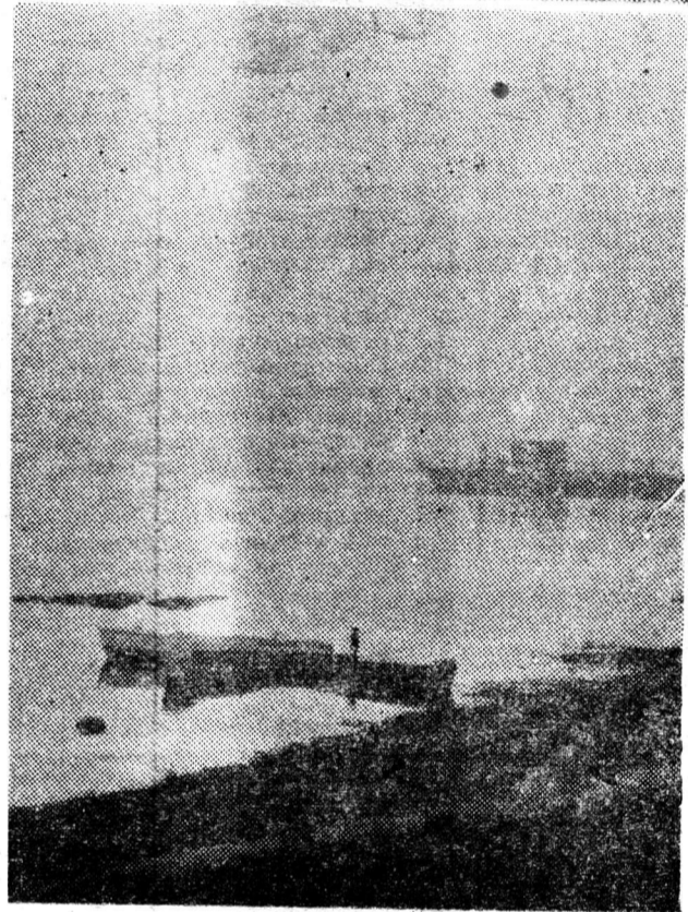
Редактор Ю. С. ЧЕРЕДНИЧЕНКО.

Представляем две его фотоработы — «В горах» и «Утро».