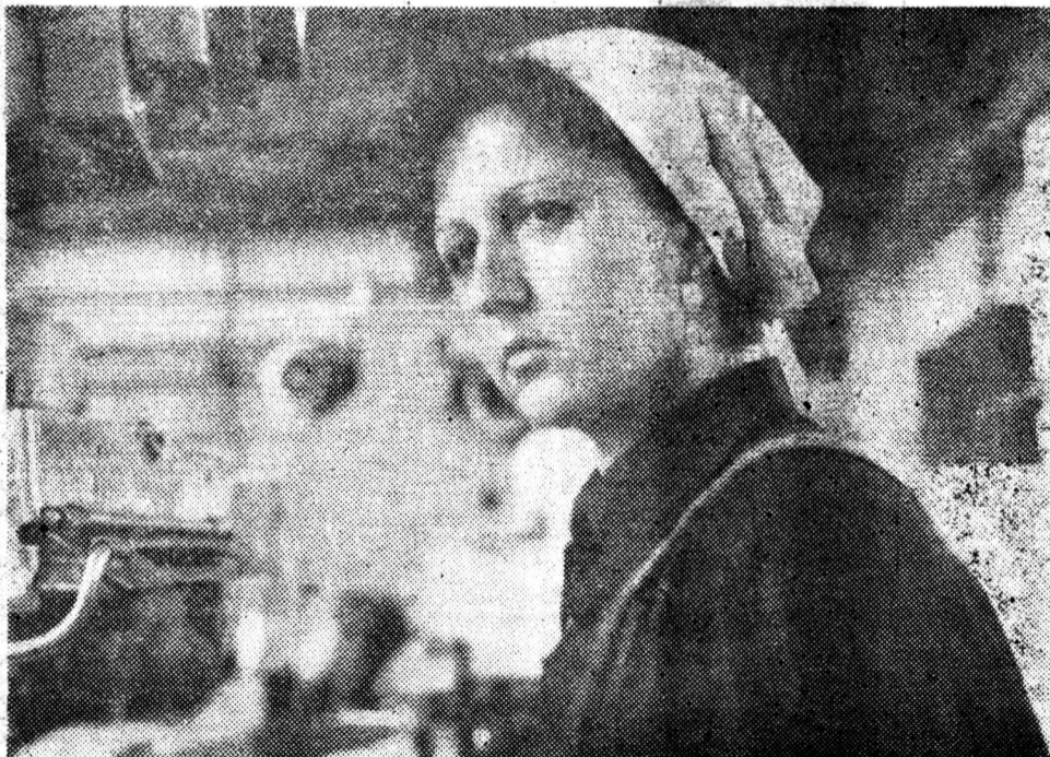
Лауреат премии ММК