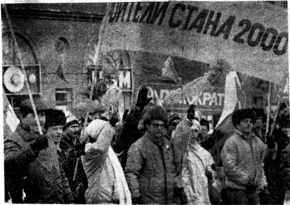
«Круглый стол «ММ»»