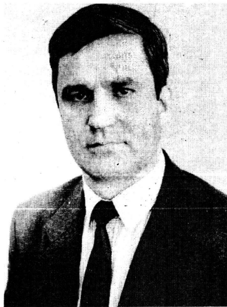
дим бартерный обмен с предприятиями и организациями страны.

Какова раскладка? 55 процентов своей продукции продаем за рубеж и 45 процентов внутри страны. Почему поступаем наперекор расчетам и уменьшаем рентабельность продукции? Все объясняется просто: внутренний рынок пока неплатежеспособен, в стране невозможно продать весь объем выпускаемой нами продукции. Поэтому снижено производство металлпроката. Работаем по взаимозачету до 90 процентов от всех поставок и не видим реальных денежных ресурсов. То есть фактически произво-