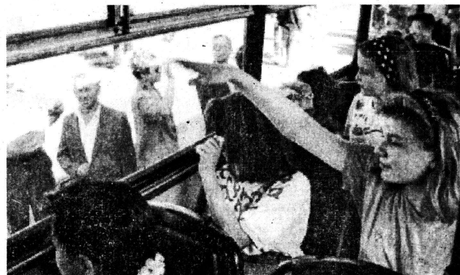
Фото и текст Ю. АЛЕКСЕЕВА.

На снимке: До свидания, мамы и папы — здравствуй, «Горное ущелье»!