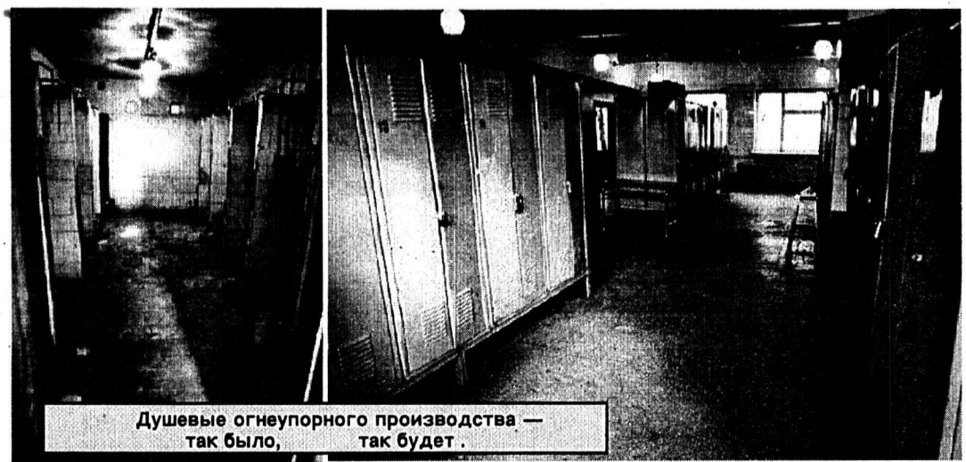
Душевые огнеупорного производства — так было, так будет.

Сегодня в ККЦ сделано уже многое из запланированных 57 пунктов цехового распоряжения. А вот работы по отделению приемки слябов, оборудованию туалета на 37 отметке придется форсировать. Предстоит отремонтировать главные посты управления отгрузки, резки, заново остеклить их. Впрочем, эта процедура носит уже не сезонный, а ежеквартальный характер — стекло при высоких температурах быстро приходит в негодность. Нужно привести в рабочее состояние механизмы открывания и закрывания ворот. Шестерни, ремни заготовлены. Но конвертерщики не спешат с их монтажом по простой причине: охочие до чужого добра люди могут еще до наступления холодов оставить цеховые ворота без ремней.