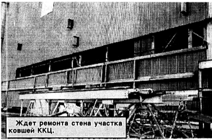
Ждет ремонта стена участка ковшей ККЦ.