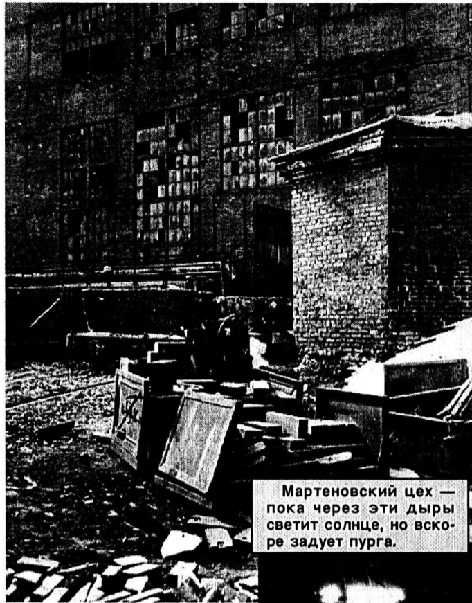
Мартеновский цех — пока через эти дыры светит солнце, но вскоре задует пурга.

Пока не удается уложиться в график по ремонту стен в конвертерном отделении, намеченное выполнено процентов на 80. Но, как заверил заместитель