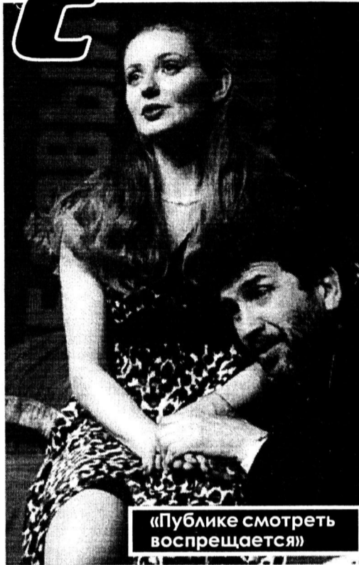
«Публике смотреть воспрещается!»

Печально, что писать обо всем этом приходится в Международный