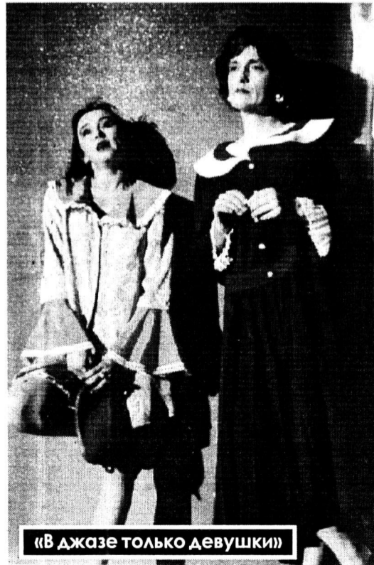
«В даже только девушки!»