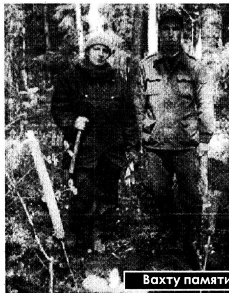
Вахту памяти несет «Рифей».

работы для нас было определено заранее: вдоль полноводного ручья, в 5-7 километрах от базового лагеря. Это, можно сказать, в самом центре Рамушевского коридора. То, что мы увидели, поразило даже опытных поисковиков.