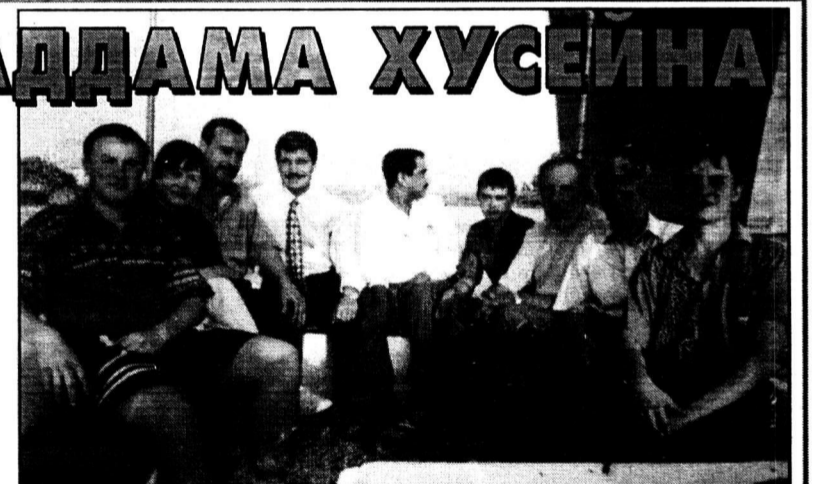
Наша команда в Багдаде.

К россиянам в Ираке относятся очень дружелюбно. Например, в