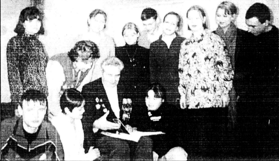
...О боях, пожарах, о друзьях-товарищах!

Все меньше и меньше остается среди нас ветеранов Великой Отечественной войны, особенно фронтовиков. И надо спешить из первых уст услышать живую историю Победы, спешить прикоснуться к их подвигу, чтобы лично услышанное от участников войны передать другим поколениям.